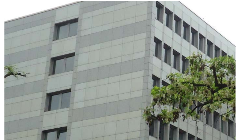
Firmensitz Berlin - Uhlandstraße